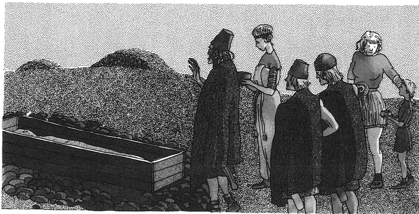
Begravelse i ældre bronzealder. Fra gravfund ved vi, at de efterladte har vist tydelig omsorg for den afdøde. F.eks. ved at lægge friske, grønne blade i bunden af kisten og anbringe den døde på et soveskind af kohud.