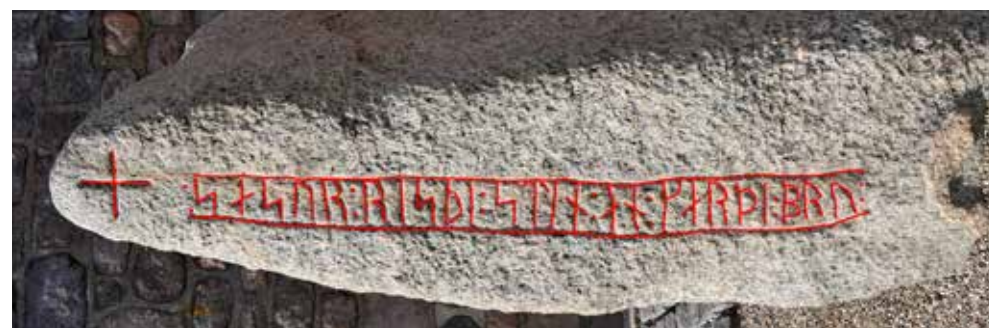
Sasserstenen med optegnet retvendt runetekst.

+ sasur : rispi : stin : an : karpi : bru : "Sasser rejste stenen og gjorde broen"