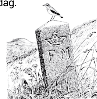
Tegning: Jens Bech © 1994

Fredning af fortidsminder Ud for langdyssen mod sydøst står en fredningssten med indhugget "F.M." for "Fredet Mindesmærke". Stenen angiver, at graven blev fredet frivilligt før Naturfredningsloven i 1937 beskyttede alle synlige fortidsminder. I Danmark har vi omkring 30.000 fredede fortidsminder, hvoraf langt størstedelen er gravmonumenter. Flertallet er gravhøje fra sten- samt bronzealderen og omkring 2.500 storstensgrave fra bondestenalderen er bevaret til i dag.