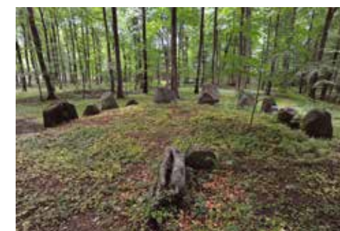
Langdyssens afgravede østende med store randsten og to sten fra et rektangulært gravkammer.

gelsesarbejder med at slå sten fra oldtidsminder til skærver - så loven kom i sidste sekund og bevirkede, at vi stadig - især på udyrkede arealer som her i skoven - kan opleve fortidens fantastiske monumenter som en del af vor fælles fortid.