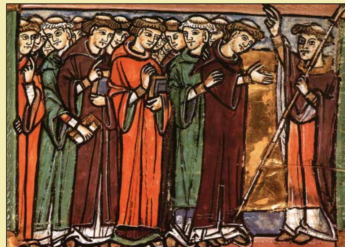
Gennem klostrene bragtes mange teknologiske fremskridt til landet. Bog- og skriftkunsten blev udviklet i klostrenes biblioteker. Vigtige teknologier - for eksempel teglbrænding og udnyttelse af vandkraft til mølledrift samt anlæggelse af fiskedamme, hospitaler med tilhørende urtehaver med lægeurter er andre vigtige fremskridt munkeordenerne medbragte. Ovenfor et træsnit med lærde munke i et svensk håndskrift fra benediktinerklostret i Næstved.

Tekst / Layout: KulturKonsulenten v. arkæolog Karsten Kristiansen, 2012, Tlf. 86 37 70 50